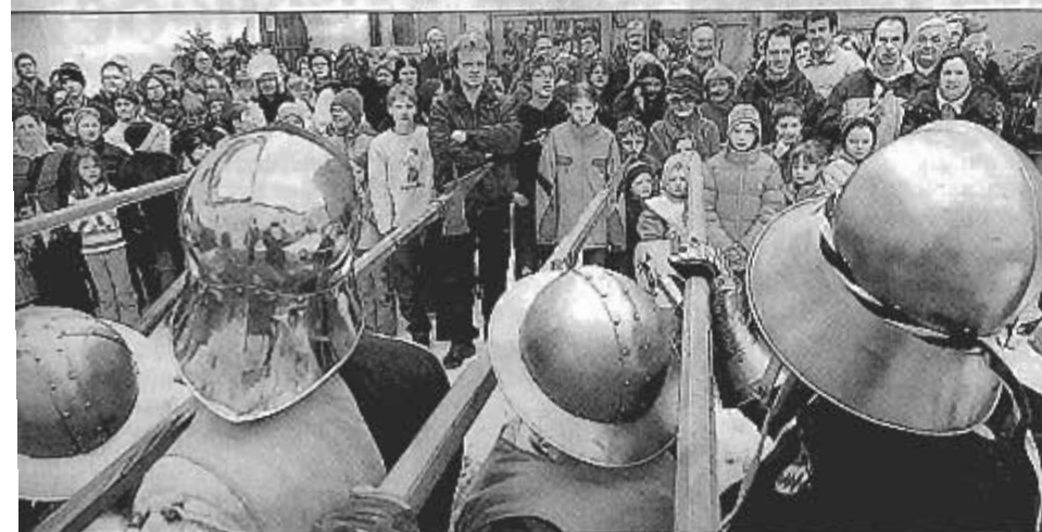
Nichts für schwache Nerven: Mit finsternen Mienen verteidigten Amberger Bürger ihr Stadtmuseum am Sonntag – natürlich nur zur Show. Cantus Ferrum zeigte eine Exerzierübung aus dem Mittelalter.

@ Weitere Bilder: oberplalznetz.de , Netzcode 50680409